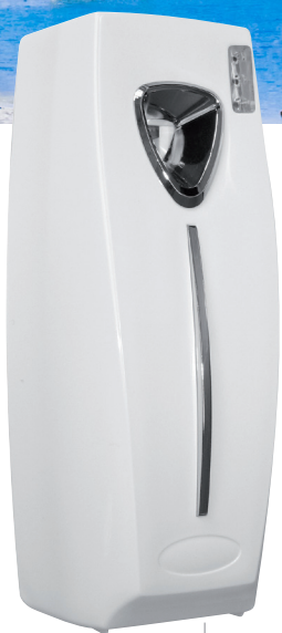
8 33 522