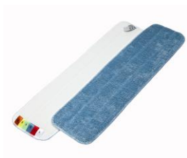
Réf. 615.540.540: Mop grattant 44 x 13 cm blanc/bleu