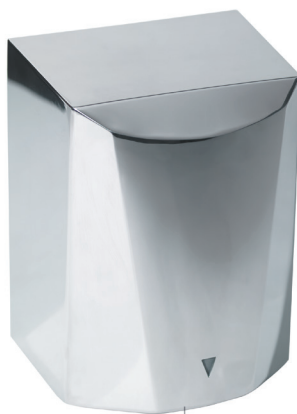
8 11 958