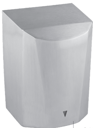
8 11 879