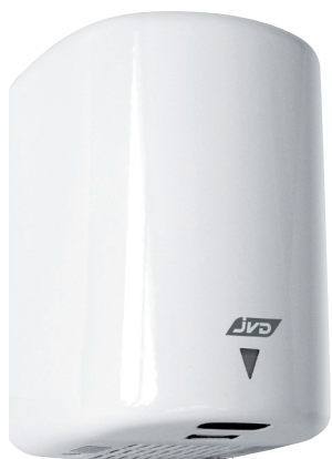
8 11 614