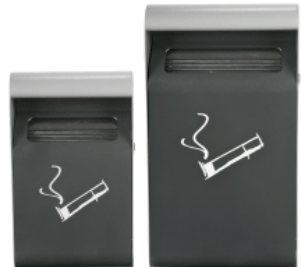
Réf : 8 99 501 et 8 99 502