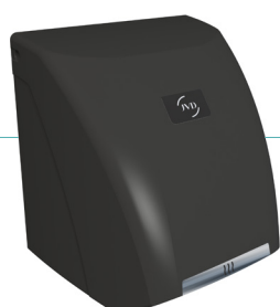
REF 8 11 1400 Zephyr automatique noir UL 1 : 6