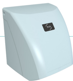
REF 8 11 1404 Zephyr automatique bleu clair UL 1 : 6