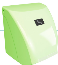
REF 8 11 1462 Zephyr automatique vert fluo UL 1 : 6