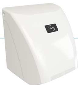
REF 8 11 1401 Zephyr automatique blanc UL 1 : 6