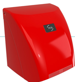
REF 8 11 1403 Zephyr automatique rouge UL 1 : 6