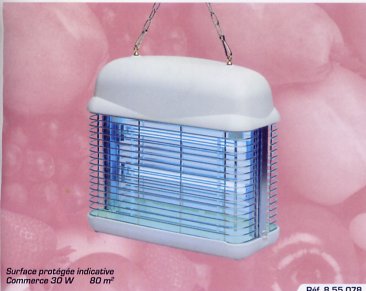
Surface protégée indicative Commerce 30 W 80 m 2

1 Unité logistique (nombre d'unités par colis). 2 Prix unitaire HT franco métropole à partir de 460 € net HT.