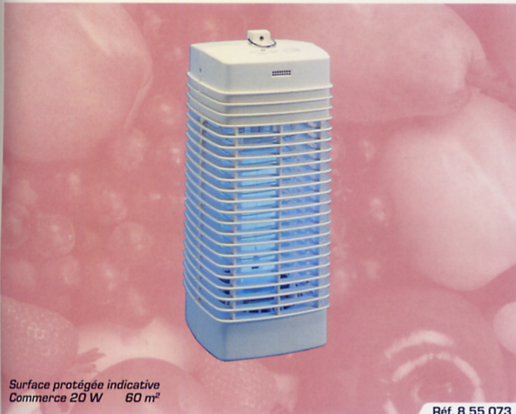
Surface protégée indicative Commerce 20 W 60 m 2